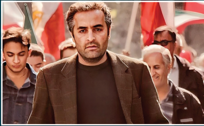
«۱۹۶۸»، دومین فیلم فوتبالی